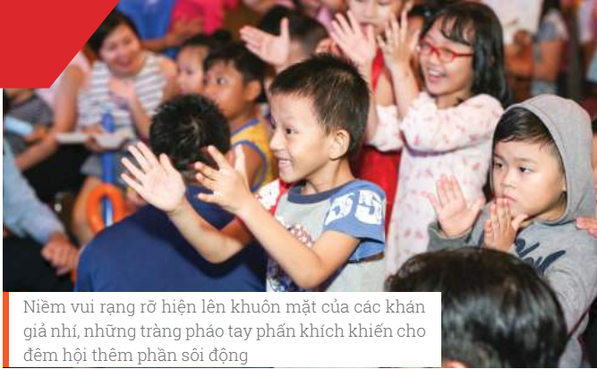
Niềm vui rạng rỡ hiện lên khuôn mặt của các khán giả nhí, những tràng pháo tay phấn khích khiến cho đêm hội thêm phần sôi động