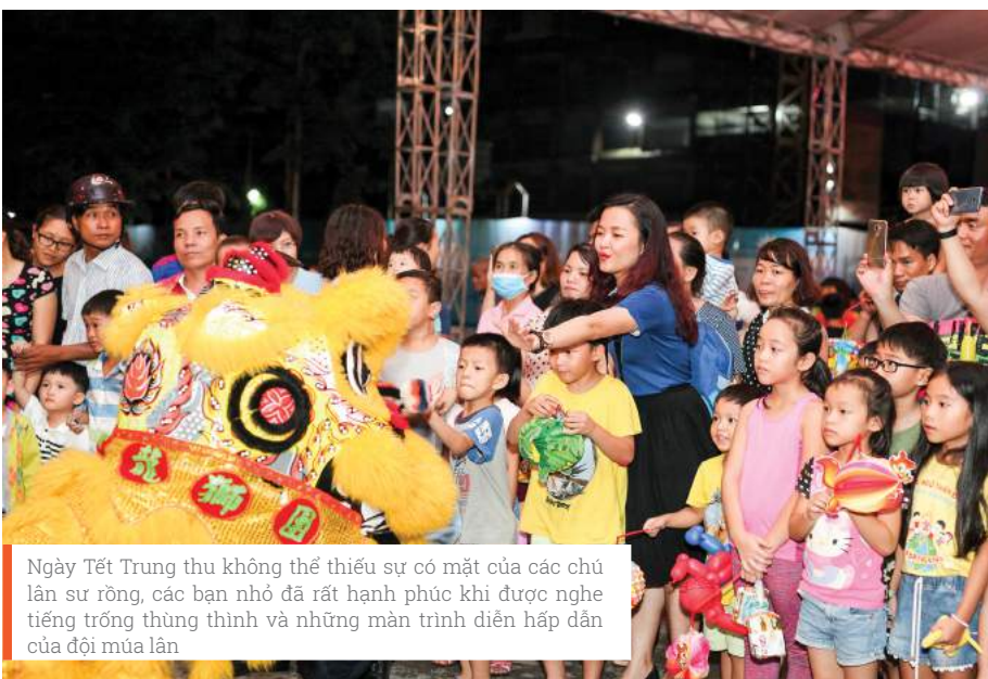
Ngày Tết Trung thu không thể thiếu sự có mặt của các chú lân sư rồng, các bạn nhỏ đã rất hạnh phúc khi được nghe tiếng trống thùng thùng và những màn trình diễn hấp dẫn của đội múa lân