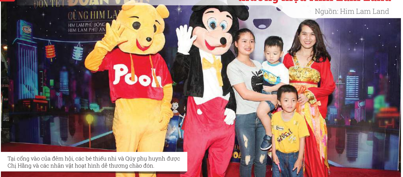
Tại cổng vào của đêm hội, các bé thiếu nhi và Quý phụ huynh được Chị Hằng và các nhân vật hoạt hình dễ thương chào đón.

Chiều ngày 30/09/2017 vừa qua tại dự án Him Lam Phú Đông (đại lộ Phạm Văn Đồng) và Him Lam Chợ Lớn (quận 6) đã diễn ra đêm hội “Vui trăng cố tích-Đón Tết đoàn viên” do Công ty CP Kinh Doanh Địa ốc Him Lam (Him Lam Land) tổ chức dành cho các bé thiếu nhi và Quý phụ huynh.