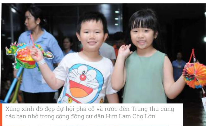
Xúng xính đồ đẹp dự hội phá cỗ và rước đèn Trung thu cùng các bạn nhỏ trong cộng đồng cư dân Him Lam Chợ Lớn