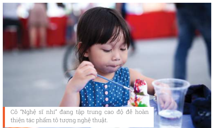
Cô "Nghệ sĩ nhí" đang tập trung cao độ để hoàn thiện tác phẩm tô tượng nghệ thuật.