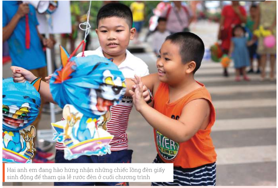
Hai anh em đang hào hứng nhận những chiếc lồng đèn giấy sinh động để tham gia lễ rước đèn ở cuối chương trình