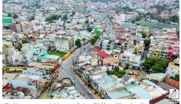
Từ lâu, xung quanh khu vực đường Tô Ngọc Vân cũng là "điểm nóng" của nhiều dự án căn hộ, nhà phố do quận Thủ Đức là địa bàn tập trung nhiều dự án hạ tầng cơ sở quy mô khá lớn của TP.HCM.