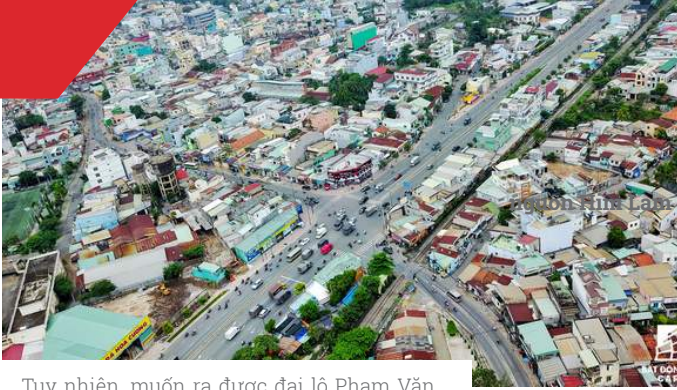
Tuy nhiên, muốn ra được đại lộ Phạm Văn Đồng, nhiều người buộc phải chạy trên con đường Tô Ngọc Vân nhỏ hẹp.