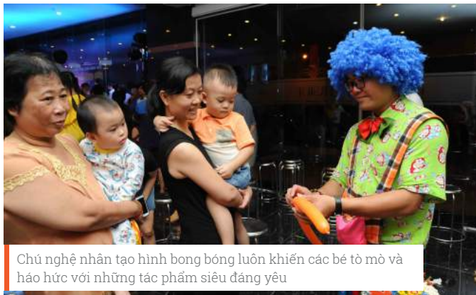
Chú nghệ nhân tạo hình bong bóng luôn khiến các bé tò mò và háo hức với những tác phẩm siêu đáng yêu