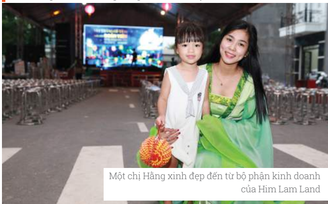
Một chị Hằng xinh đẹp đến từ bộ phận kinh doanh của Him Lam Land