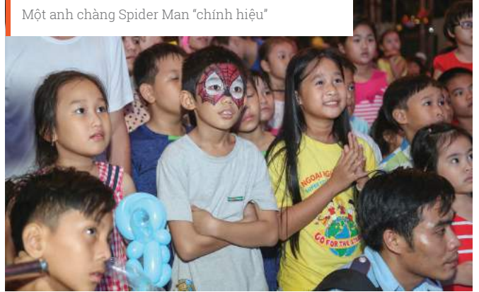
Một anh chàng Spider Man "chính hiệu"