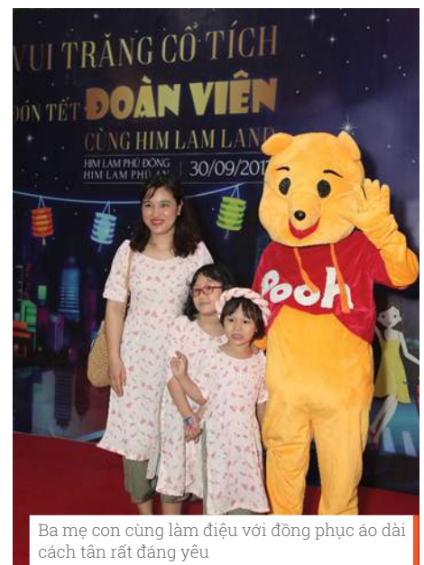
Ba mẹ con cùng làm điệu với đồng phục áo dài cách tân rất đáng yêu