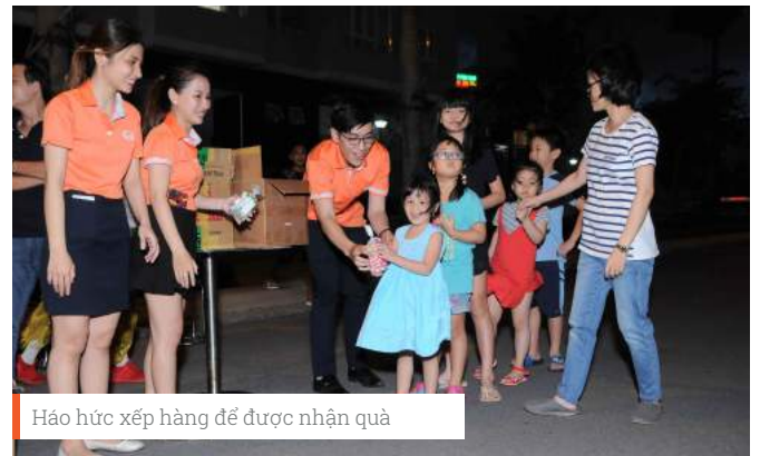
Háo hức xếp hàng để được nhận quà