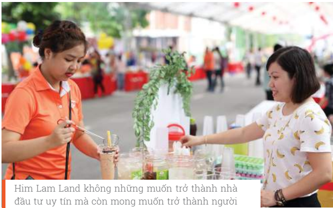
Him Lam Land không những muốn trở thành nhà đầu tư uy tín mà còn mong muốn trở thành người bạn đồng hành với cộng đồng cư dân tại đây