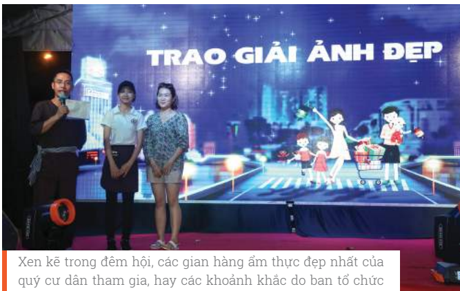
Xen kẽ trong đêm hội, các gian hàng ẩm thực đẹp nhất của quý cư dân tham gia, hay các khoảnh khắc do ban tổ chức "chớp" được đã nhận được những giải thưởng khích lệ