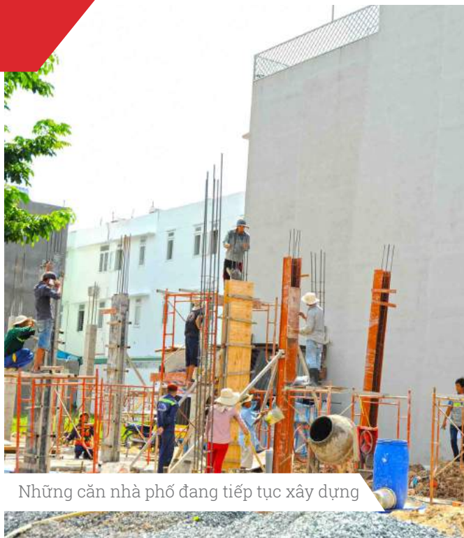
Những căn nhà phố đang tiếp tục xây dựng