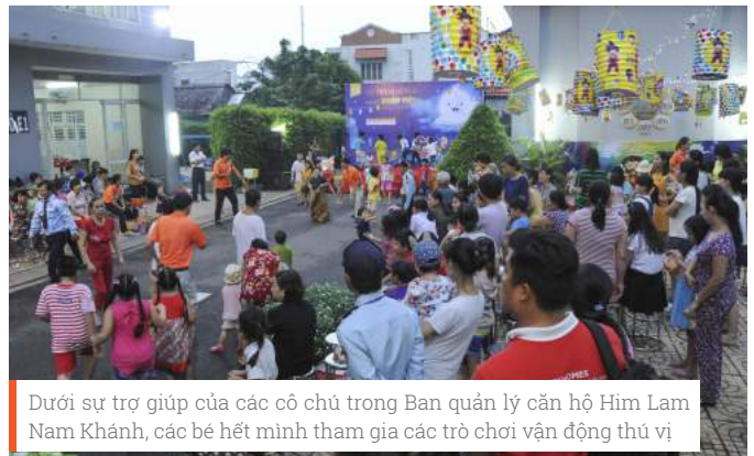
Dưới sự trợ giúp của các cô chủ trong Ban quản lý căn hộ Him Lam Nam Khánh, các bé hết mình tham gia các trò chơi vận động thú vị