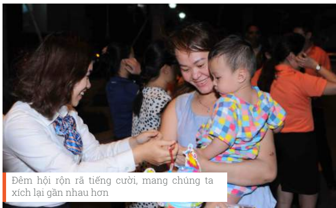
Đêm hội rộn rã tiếng cười, mang chúng ta xích lại gần nhau hơn