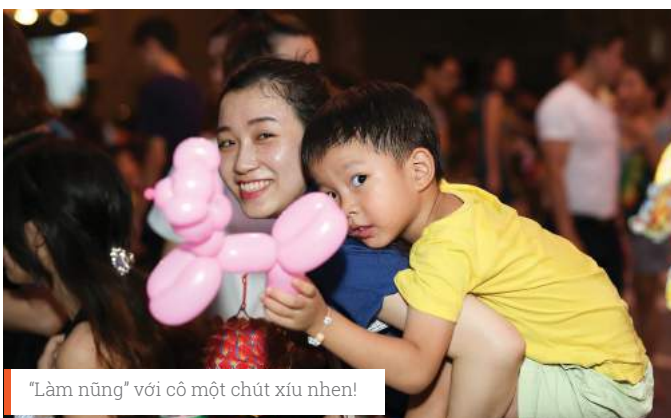
"Làm nũng" với cô một chút xíu nhen!