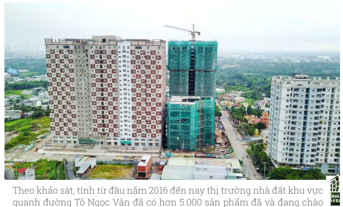
Theo khảo sát, tính từ đầu năm 2016 đến nay thị trường nhà đất khu vực quanh đường Tô Ngọc Vân đã có hơn 5.000 sản phẩm đã và đang chào bán. Giá bán phổ biến của các sản phẩm trên trục đường này thuộc phân khúc bình dân, từ 850 triệu đồng đến dưới một tỷ đồng cho căn 2 phòng ngủ. Sản phẩm có giá bán 1,2-2 tỷ đồng một căn không nhiều.