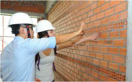
"Mục sở thị" giúp khách hàng mãn nhãn khi tham quan thực tế căn hộ