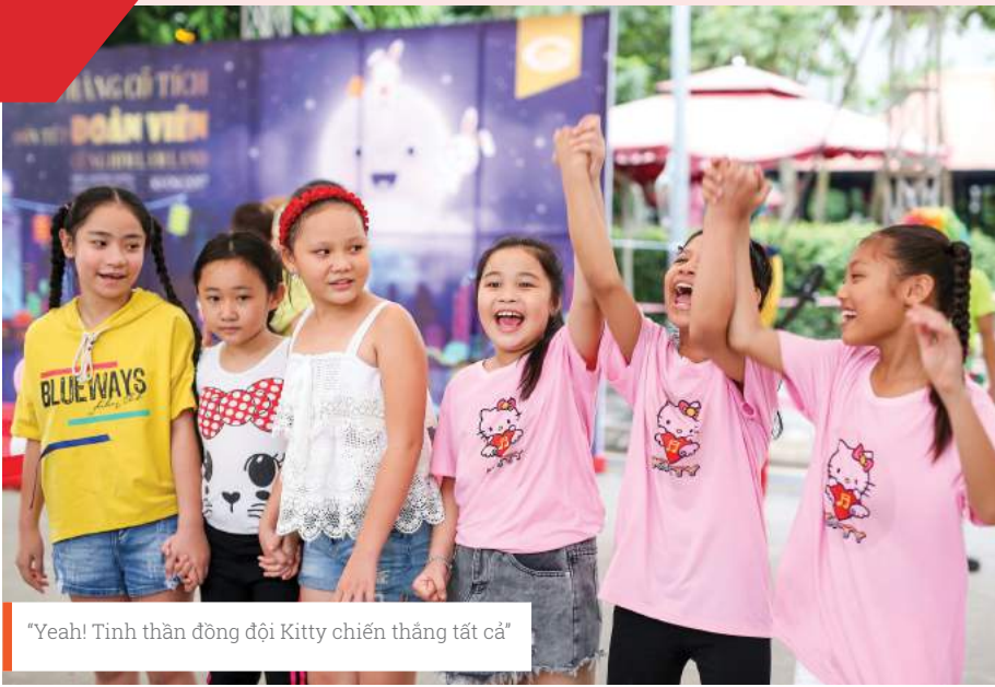
"Yeah! Tinh thần đồng đội Kitty chiến thắng tất cả"