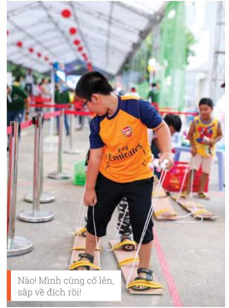
Nào! Mình cùng cố lên, sắp về đích rồi!