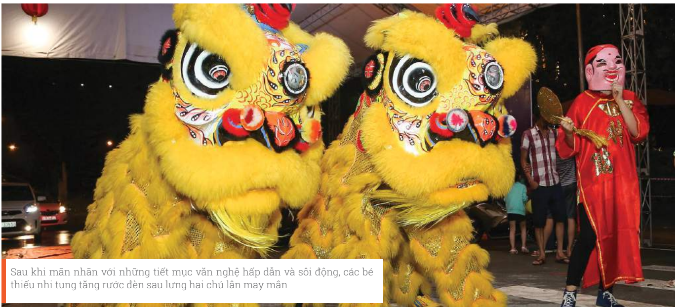
Sau khi mãn nhãn với những tiết mục văn nghệ hấp dẫn và sôi động, các bé thiếu nhi tung tăng rước đèn sau lưng hai chú lân may mắn