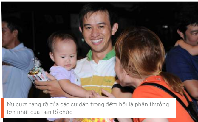
Nụ cười rạng rỡ của các cư dân trong đêm hội là phần thưởng lớn nhất của Ban tổ chức