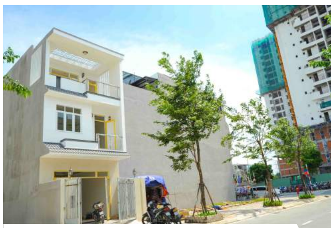
Những dãy nhà phố khang trang được hình thành