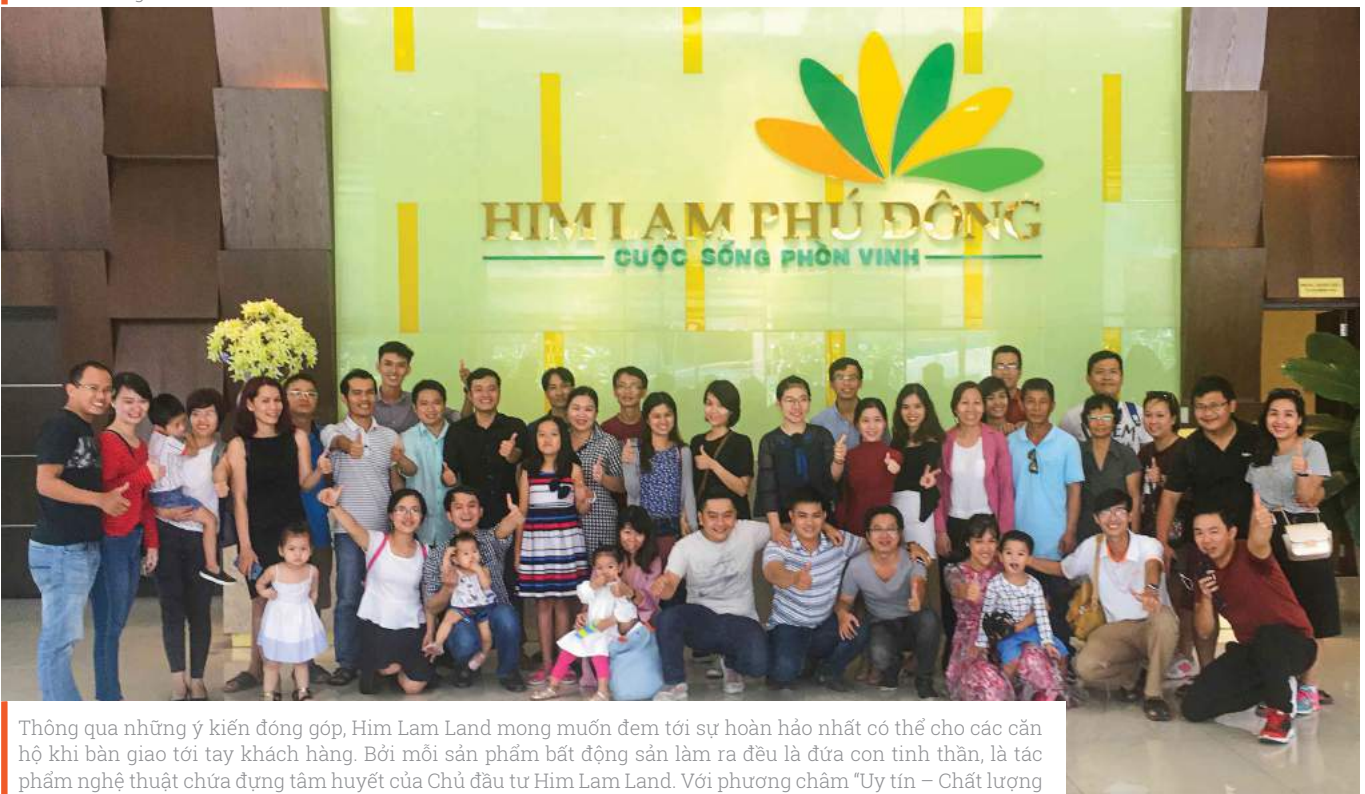
Thông qua những ý kiến đóng góp, Him Lam Land mong muốn đem tới sự hoàn hảo nhất có thể cho các căn hộ khi bàn giao tới tay khách hàng. Bởi mỗi sản phẩm bất động sản làm ra đều là đứa con tinh thần, là tác phẩm nghệ thuật chứa đựng tâm huyết của Chủ đầu tư Him Lam Land. Với phương châm “Uy tín – Chất lượng – Hiệu quả”, Him Lam Land luôn mong muốn đem tới những lợi ích tốt nhất cho khách hàng, tạo dựng được lòng tin vững chắc bằng chính sự minh bạch, văn minh trong mọi hoạt động. Qua đó, khẳng định vai trò của một Chủ đầu tư uy tín trong thị trường Bất động sản tại TP.HCM.