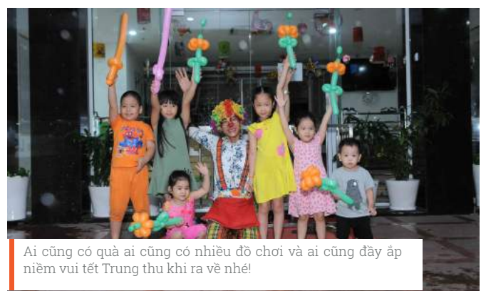
Ai cũng có quà ai cũng có nhiều đồ chơi và ai cũng đầy áp niềm vui tết Trung thu khi ra về nhé!