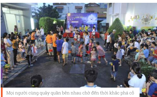
Mọi người cùng quây quần bên nhau chờ đến thời khắc phá cỗ