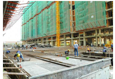
Hồ bơi đang thi công hoàn thiện