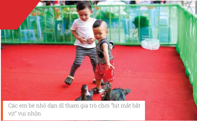
Các em bé nhỏ dạn dĩ tham gia trò chơi "bịt mắt bắt vịt" vui nhộn