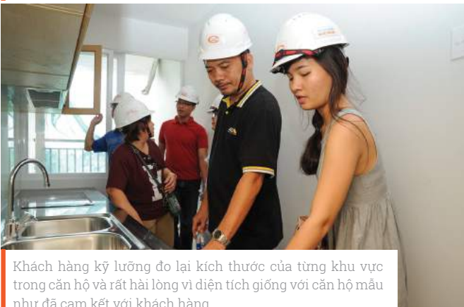
Khách hàng kỹ lưỡng đo lại kích thước của từng khu vực trong căn hộ và rất hài lòng vì diện tích giống với căn hộ mẫu như đã cam kết với khách hàng