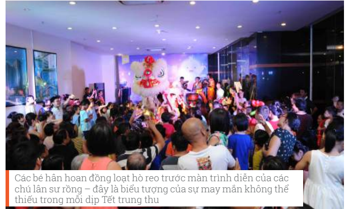
Các bé hân hoan đồng loạt hò reo trước màn trình diễn của các chú lân sư rồng – đây là biểu tượng của sự may mắn không thể thiếu trong mỗi dịp Tết trung thu

H òa chung cùng không khí đêm hội “Vui trăng Cổ tích – Đón Tết đoàn viên”, chiều tối ngày 03/10/2017, các bé thiếu nhi tại Him Lam Riverside và Him Lam Nam Khánh đã có một đêm Trung thu đáng nhớ với nhiều hoạt động sôi nổi và ý nghĩa.