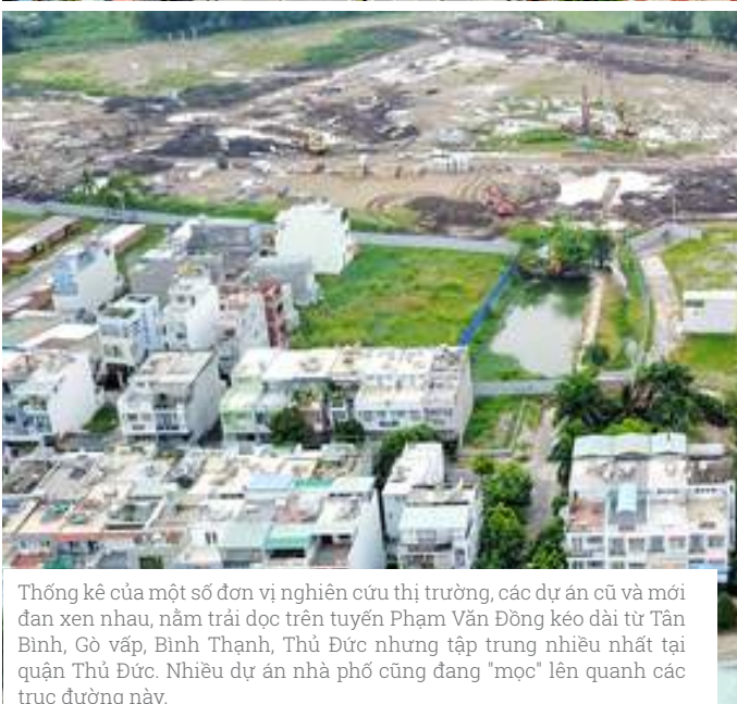
Thống kê của một số đơn vị nghiên cứu thị trường, các dự án cũ và mới đan xen nhau, nằm trải dọc trên tuyến Phạm Văn Đồng kéo dài từ Tân Bình, Gò Vấp, Bình Thạnh, Thủ Đức nhưng tập trung nhiều nhất tại quận Thủ Đức. Nhiều dự án nhà phố cũng đang "mọc" lên quanh các trục đường này.