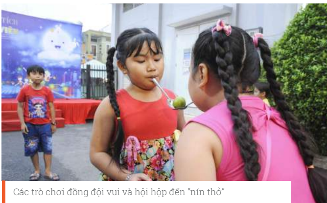
Các trò chơi đồng đội vui và hội hợp đến "nín thở"