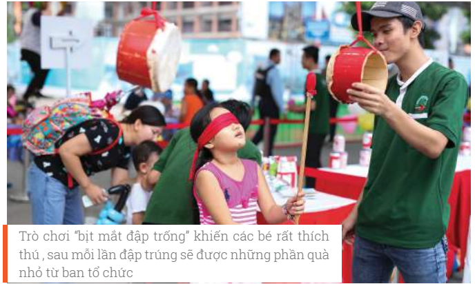
Trò chơi "bịt mắt đập trống" khiến các bé rất thích thú, sau mỗi lần đập trúng sẽ được những phần quà nhỏ từ ban tổ chức