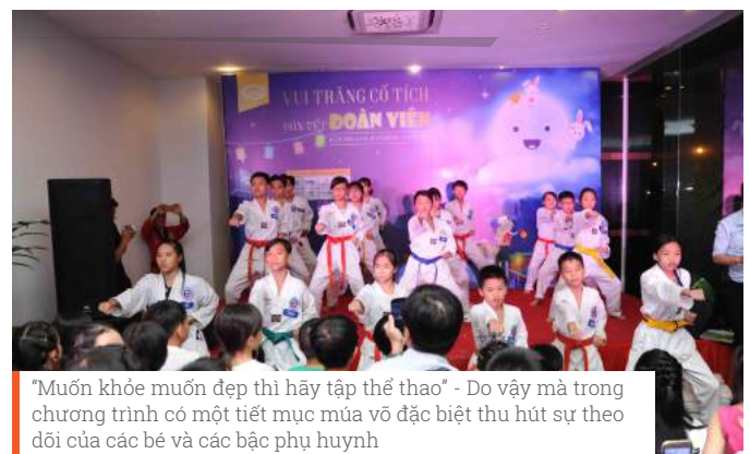
“Muốn khỏe muốn đẹp thì hãy tập thể thao” - Do vậy mà trong chương trình có một tiết mục múa võ đặc biệt thu hút sự theo dõi của các bé và các bậc phụ huynh