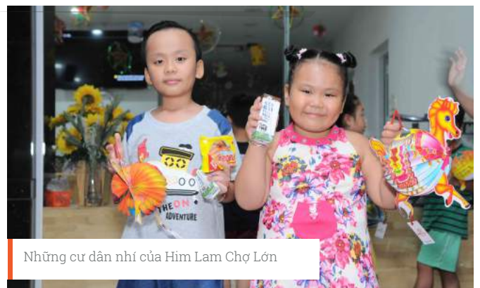
Những cư dân nhí của Him Lam Chợ Lớn