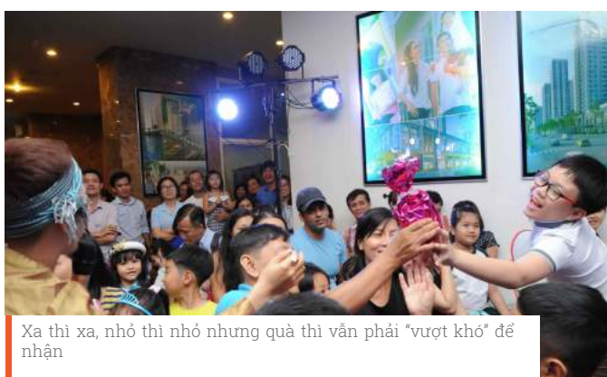
Xa thì xa, nhỏ thì nhỏ nhưng quà thì vẫn phải “vượt khó” để nhận