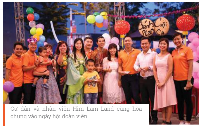
Cư dân và nhân viên Him Lam Land cùng hòa chung vào ngày hội đoàn viên