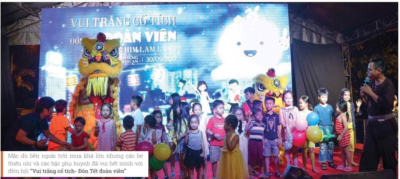
Mặc dù bên ngoài trời mưa khá lớn nhưng các bé thiếu nhi và các bậc phụ huynh đã vui hết mình với đêm hội "Vui trăng cổ tích- Đón Tết đoàn viên"