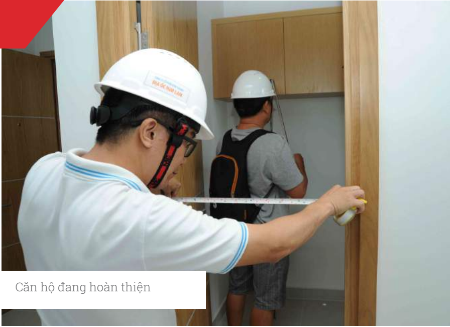
Căn hộ đang hoàn thiện