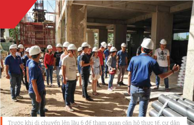
Trước khi đi chuyển lên lầu 6 để tham quan căn hộ thực tế, cư dân được phổ biến về quy định bảo hộ, các điều cần tuân thủ để đảm bảo an toàn khi di chuyển trong công trường.