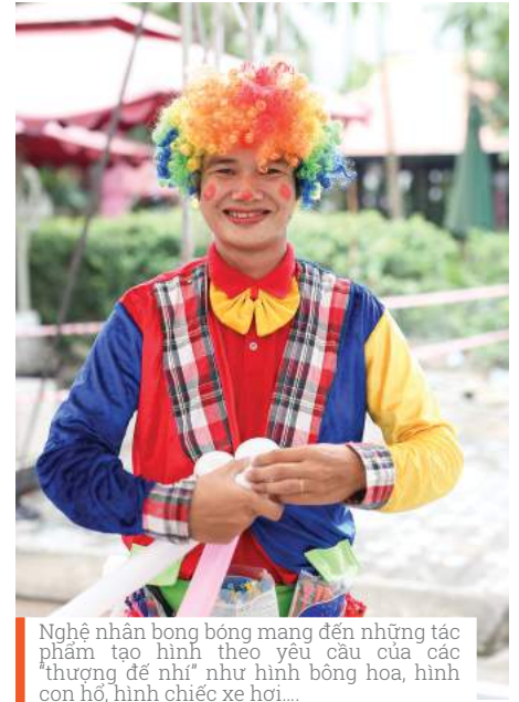
Nghệ nhân bong bóng mang đến những tác phẩm tạo hình theo yêu cầu của các "thượng đế nhí" như hình bông hoa, hình con hổ, hình chiếc xe hơi....