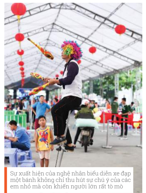
Sự xuất hiện của nghệ nhân biểu diễn xe đạp một bánh không chỉ thu hút sự chú ý của các em nhỏ mà còn khiến người lớn rất tò mò