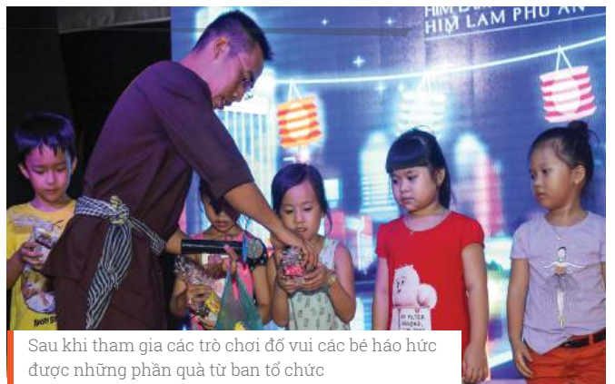
Sau khi tham gia các trò chơi đồ vui các bé háo hức được những phần quà từ ban tổ chức