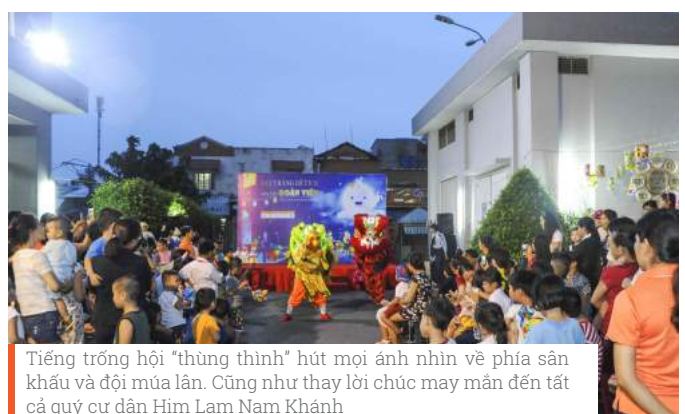
Tiếng trống hội "thùng thình" hút mọi ánh nhìn về phía sân khấu và đội múa lân. Cũng như thay lời chúc may mắn đến tất cả quý cư dân Him Lam Nam Khánh