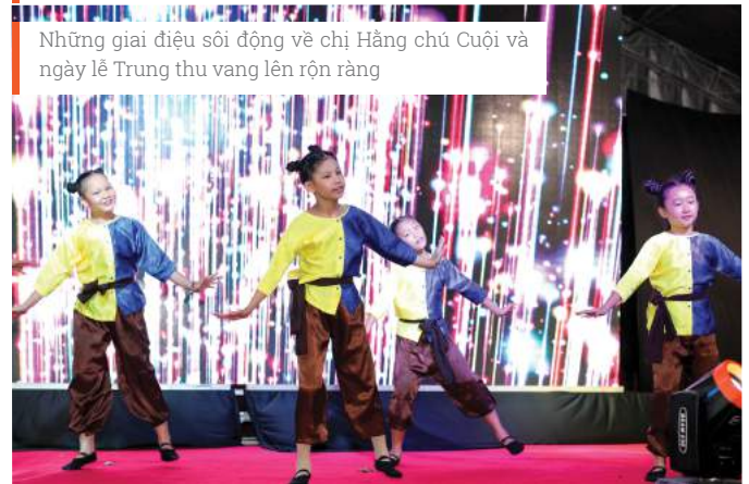
Những giai điệu sôi động về chị Hằng chú Cuội và ngày lễ Trung thu vang lên rộn ràng