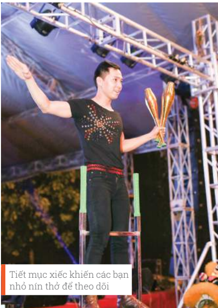
Tiết mục xiếc khiến các bạn nhỏ nín thở để theo dõi