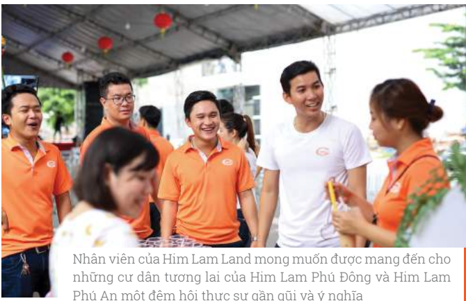
Nhân viên của Him Lam Land mong muốn được mang đến cho những cư dân tương lai của Him Lam Phú Đông và Him Lam Phú An một đêm hội thực sự gần gũi và ý nghĩa