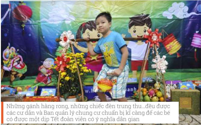
Những gánh hàng rong, những chiếc đèn trung thu...đều được các cư dân và Ban quản lý chung cư chuẩn bị kĩ càng để các bé có được một dịp Tết đoàn viên có ý nghĩa dân gian