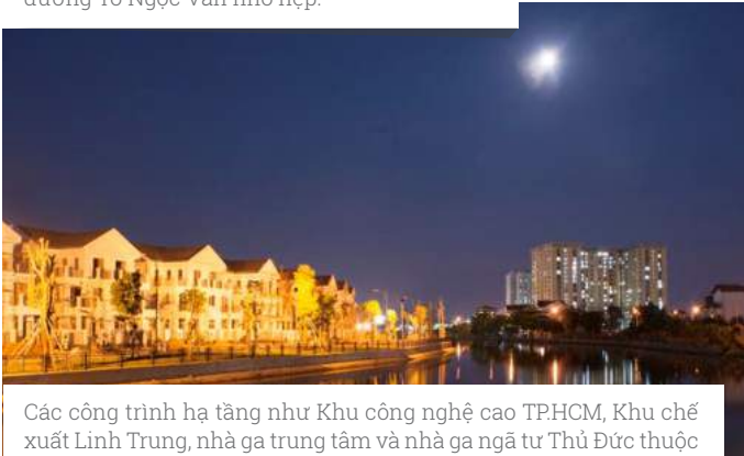
Các công trình hạ tầng như Khu công nghệ cao TP.HCM, Khu chế xuất Linh Trung, nhà ga trung tâm và nhà ga ngã tư Thủ Đức thuộc tuyến metro số 1 Bến Thành - Suối Tiên, dự án Bến Xe miền Đông mới đang được xây dựng, Khu đô thị Đại học Quốc gia TP.HCM...