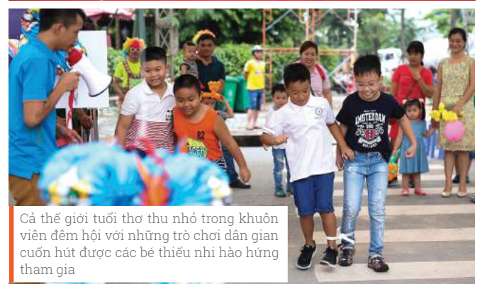
Cả thế giới tuổi thơ thu nhỏ trong khuôn viên đêm hội với những trò chơi dân gian cuốn hút được các bé thiếu nhi hào hứng tham gia