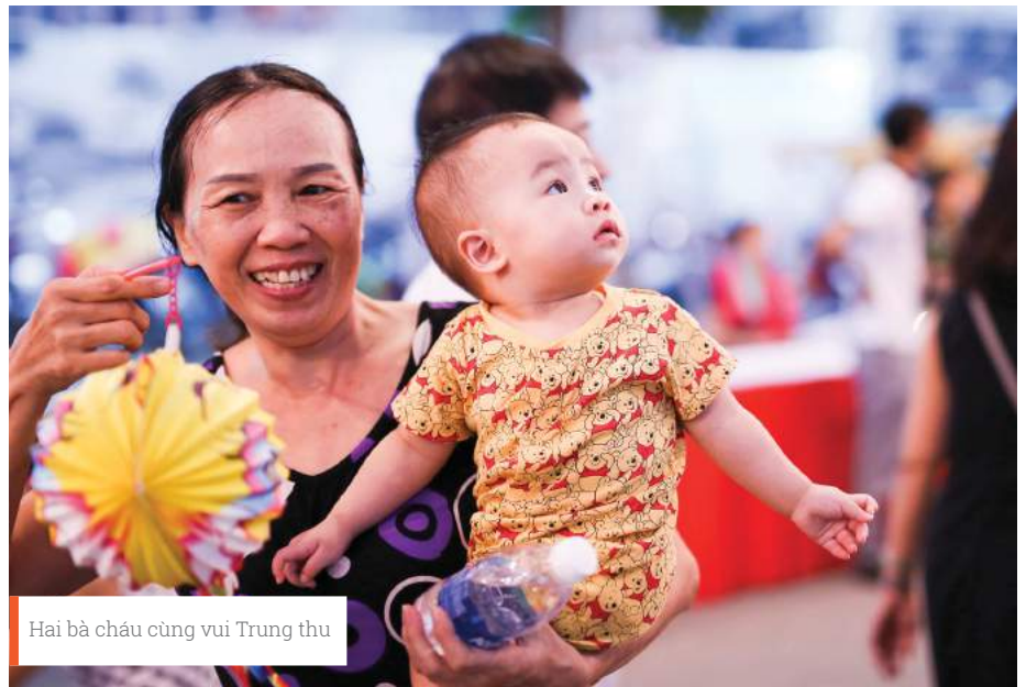
Hai bà cháu cùng vui Trung thu