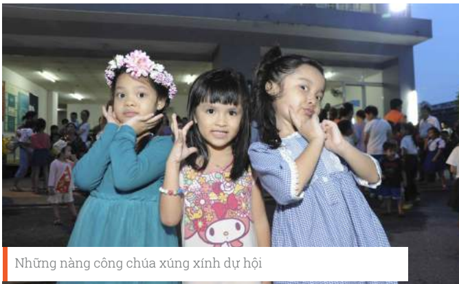
Những nàng công chúa xứng xinh dự hội