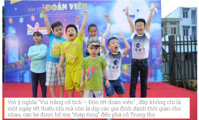
Với ý nghĩa "Vui trăng cổ tích – Đón tết đoàn viên", đây không chỉ là một ngày tết thiếu nhi mà còn là dịp các gia đình dành thời gian cho nhau, các bé được bố mẹ "thập tung" đến phá cỗ Trung thu