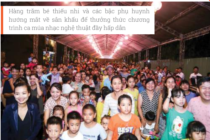
Hàng trăm bé thiếu nhi và các bậc phụ huynh hướng mắt về sân khấu để thưởng thức chương trình ca múa nhạc nghệ thuật đầy hấp dẫn