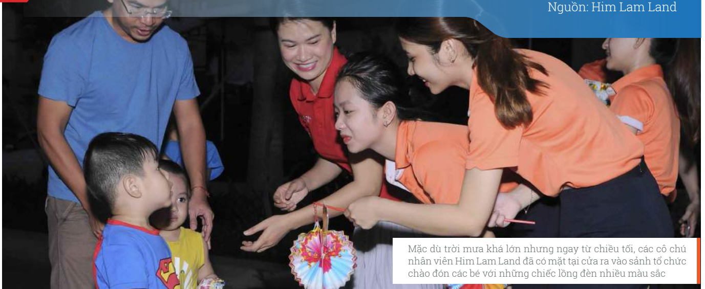
Mặc dù trời mưa khá lớn nhưng ngay từ chiều tối, các cô nhân viên Him Lam Land đã có mặt tại cửa ra vào sảnh tổ chức chào đón các bé với những chiếc lồng đèn nhiều màu sắc