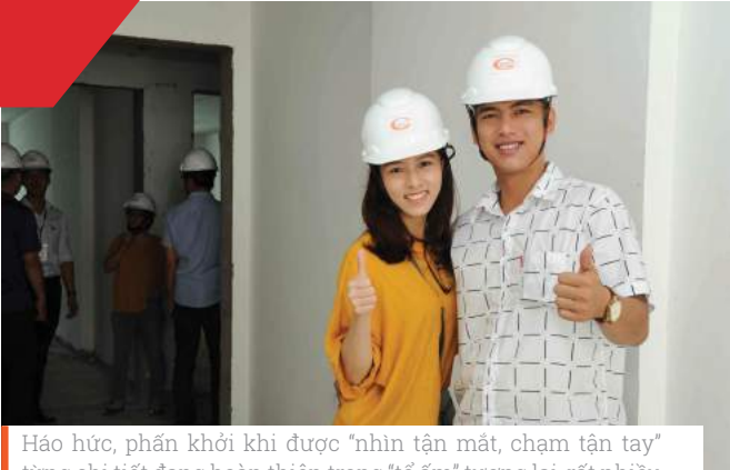
Háo hức, phấn khởi khi được “nhìn tận mắt, chạm tận tay” từng chi tiết đang hoàn thiện trong “tổ ấm” tương lai, rất nhiều gia đình trẻ đang mong chờ ngày công trình chính thức được bàn giao vào cuối năm 2017.