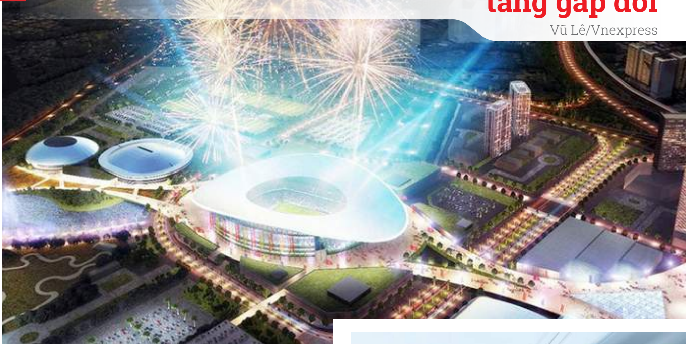
Phối cảnh dự án khu liên hợp thể thao Rạch Chiếc tại quận 2, TP.HCM, phục vụ SEA Games 2021

Đ ất đường Nguyễn Thị Định dẫn về khu thể thao Rạch Chiếc phục vụ SEA Games bất ngờ vọt lên 80,55 triệu đồng mỗi m 2 , tăng 97%.