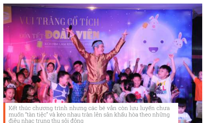
Kết thúc chương trình nhưng các bé vẫn còn lưu luyến chưa muốn “tản tiệc” và kéo nhau tràn lên sân khấu hòa theo những điệu nhạc trung thu sôi động