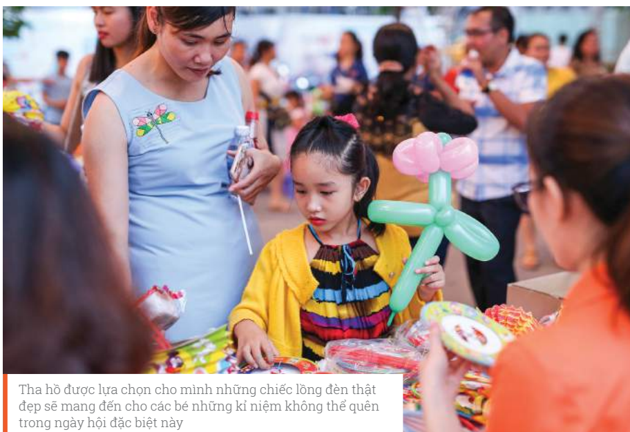
Tha hồ được lựa chọn cho mình những chiếc lồng đèn thật đẹp sẽ mang đến cho các bé những kỉ niệm không thể quên trong ngày hội đặc biệt này