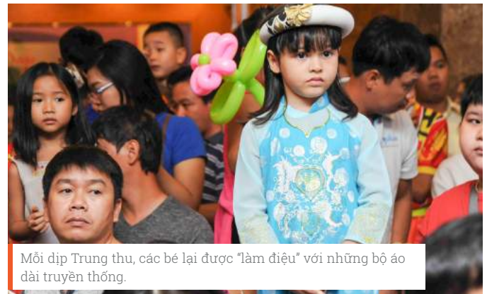
Mỗi dịp Trung thu, các bé lại được “làm điệu” với những bộ áo dài truyền thống.