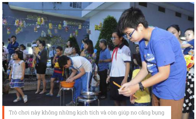
Trò chơi này không những kịch tích và còn giúp no căng bụng