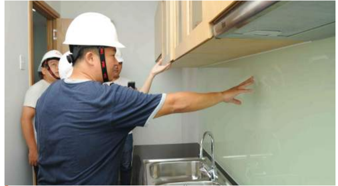
So với các loại hình nhà ở khác, không gian bếp trong căn hộ thường có diện tích nhỏ, thiết kế công năng sử dụng và độ bền cho bếp được đề cao hơn yếu tố thẩm mỹ và kinh tế. Với thói quen nấu ăn cầu kỳ nhiều gia vị của người Việt đòi hỏi phải xử lý thoát khói (mùi) và thông gió tốt trong phòng bếp.