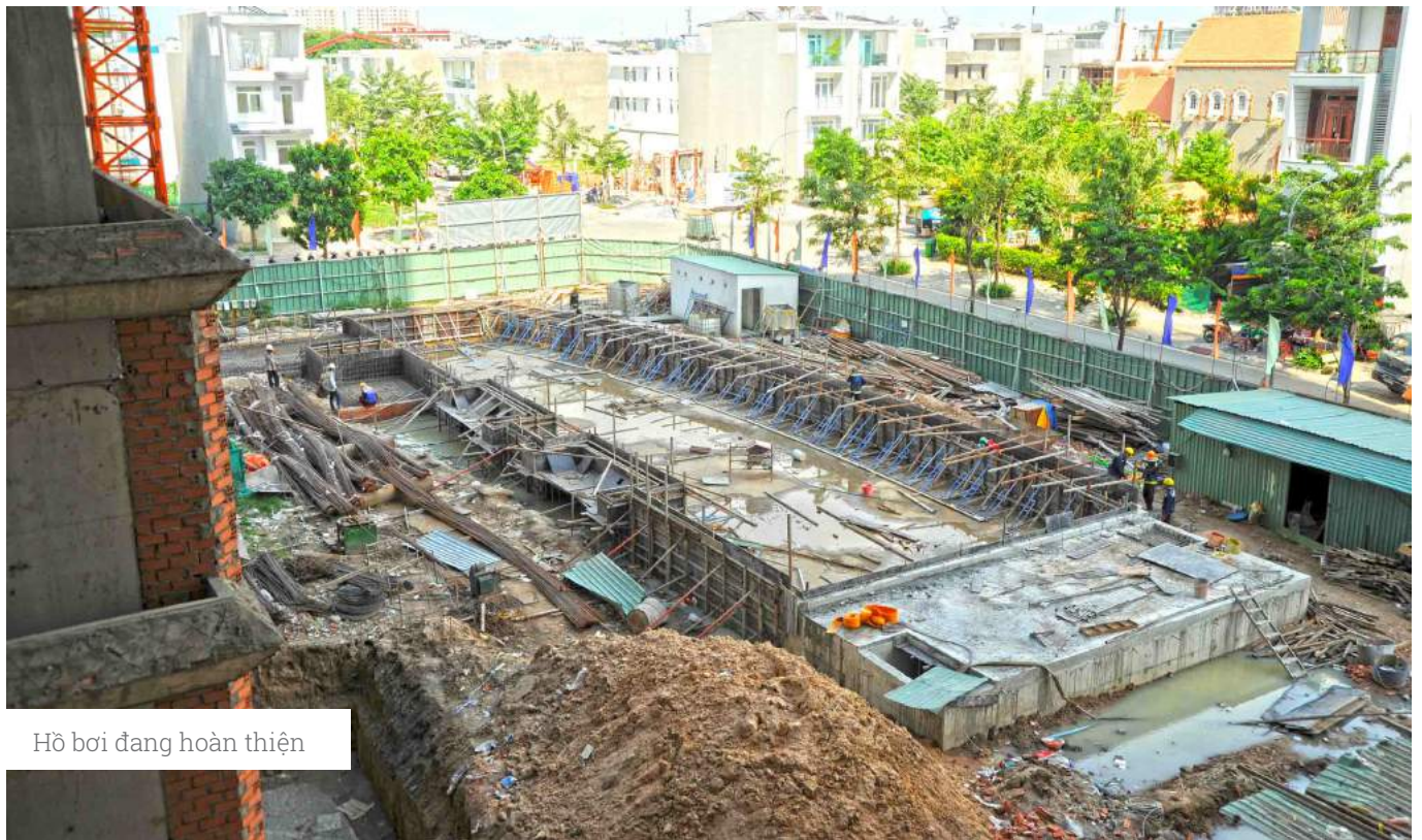
Hồ bơi đang hoàn thiện