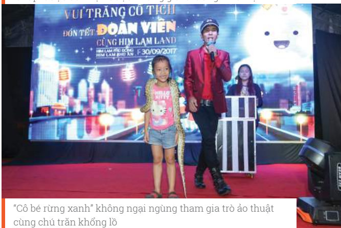
"Cô bé rừng xanh" không ngại ngần tham gia trò ảo thuật cùng chủ nhân khổng lồ