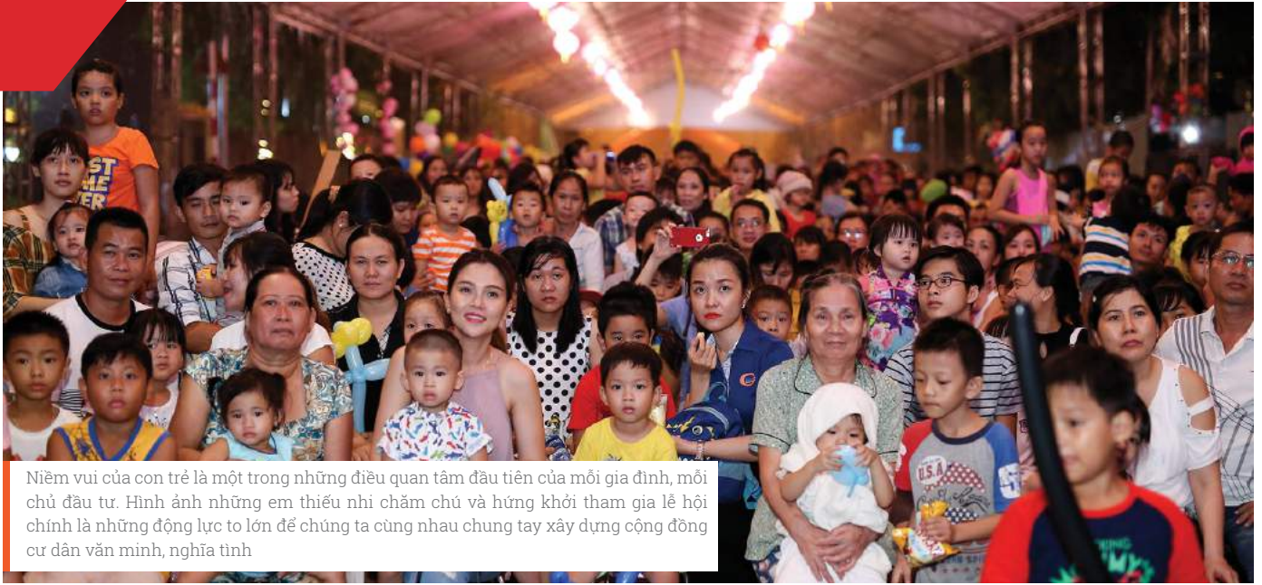
Niềm vui của con trẻ là một trong những điều quan tâm đầu tiên của mỗi gia đình, mỗi chủ đầu tư. Hình ảnh những em thiếu nhi chăm chú và hứng khởi tham gia lễ hội chính là những động lực to lớn để chúng ta cùng nhau chung tay xây dựng cộng đồng cư dân văn minh, nghĩa tình