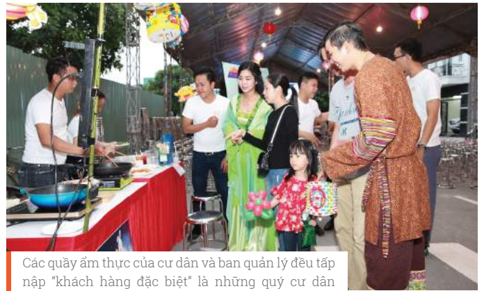
Các quầy ẩm thực của cư dân và ban quản lý đều tập nập "khách hàng đặc biệt" là những quý cư dân tương lai