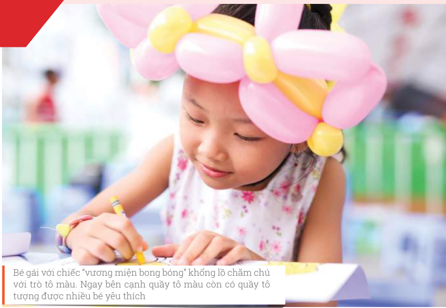
Bé gái với chiếc "vương miện bong bóng" khổng lồ chăm chú với trò tô màu. Ngay bên cạnh quầy tô màu còn có quầy tô tượng được nhiều bé yêu thích