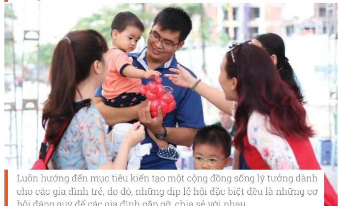
Luôn hướng đến mục tiêu kiến tạo một cộng đồng sống lý tưởng dành cho các gia đình trẻ, do đó, những dịp lễ hội đặc biệt đều là những cơ hội đáng quý để các gia đình gặp gỡ, chia sẻ với nhau